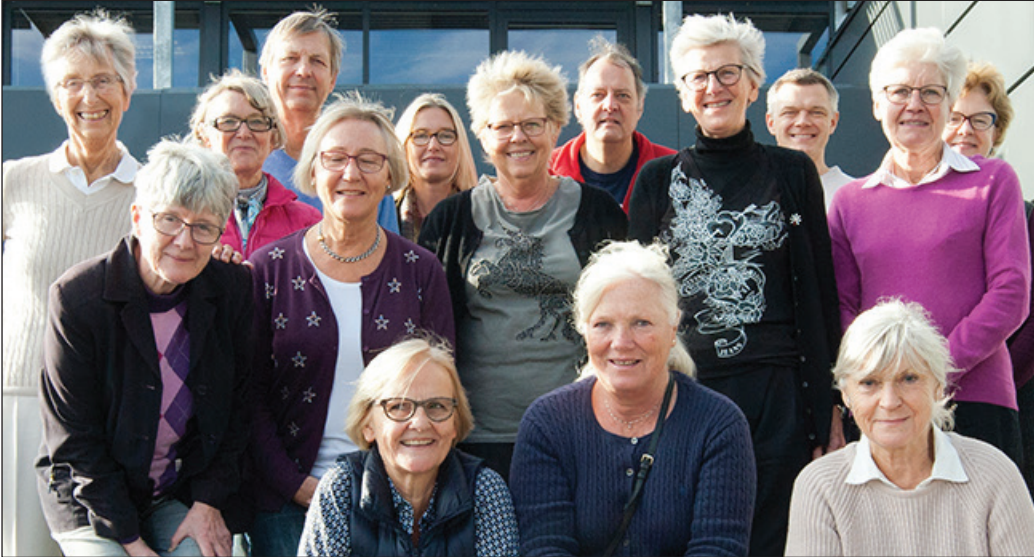
Disse 15 var med på Hold 1 til førstehjælpskursus - og nu følger yderligere to hold.