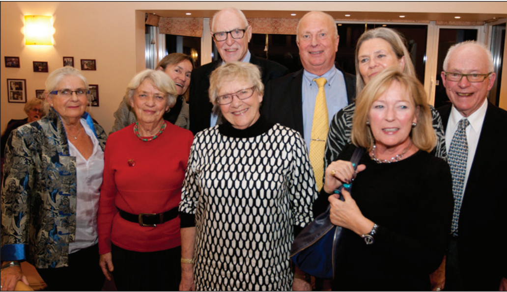
Dette er Quizudvalget, som tilrettelægger Quizzen til Solhvervsfesten torsdag 3. december.