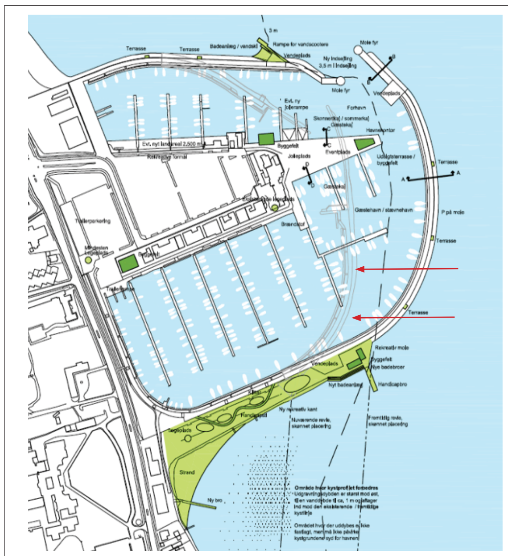
Model 3: Det nederste grønne område er Sydstranden og Laugets område, som foreslås retableret som et nyt badeområde. Øverst Vandskibbroen, hvor der også foreslås et mindre badeanlæg og en rampe til vandscootere. De røde pile viser den nuværende Syd mole.